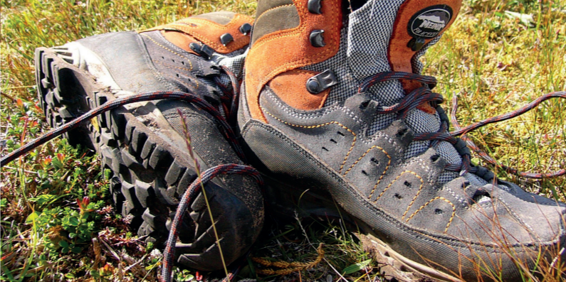
Wilde Waldrundwanderung